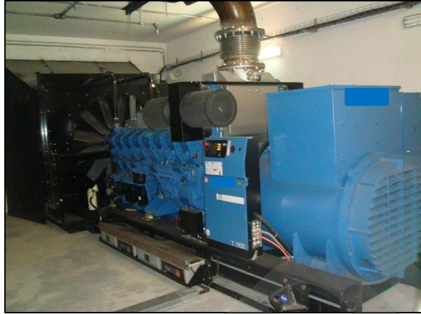
Imagen 29.Grupo electrógeno.

Sistema de alimentación autónomo que permite disponer de una alimentación y suministrar energía eléctrica por falta de acometida eléctrica durante tiempo definido.