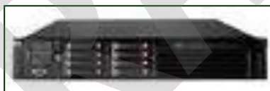
Imagen 26. Grabador de video.

Equipamiento Hardware del Sistema CCTV, para la grabación de imágenes.