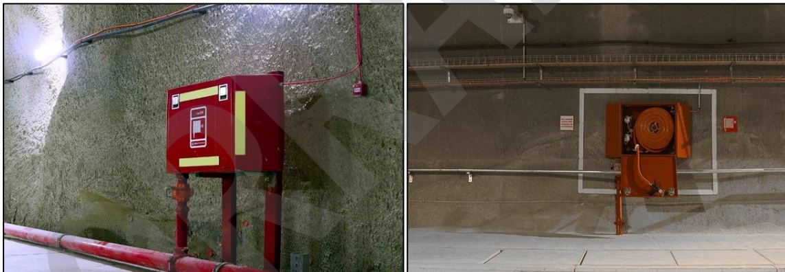
Imagen 7. BIE

Una BIE (boca de incendio equipada) es un punto fijo para la lucha contra incendios dispuesto en pared cuyo objetivo es suministrar agua en un punto concreto a una presión y caudal mínimo, el cual está conectado a un sistema de abastecimiento de agua mediante una red de tuberías.