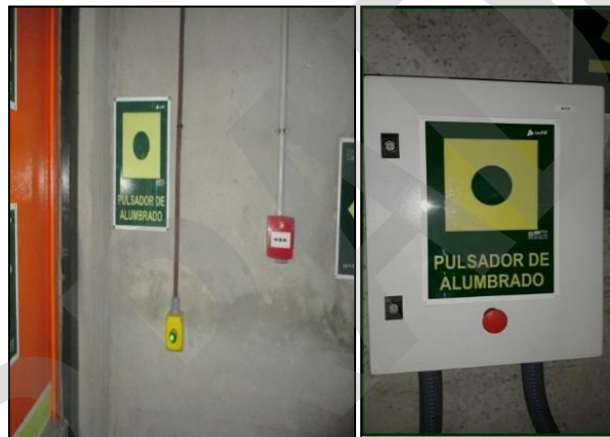
Imagen 22. Pulsador de alumbrado de emergencia

Componente eléctrico que permite o impide el paso de la corriente eléctrica cuando se aprieta o pulsa.