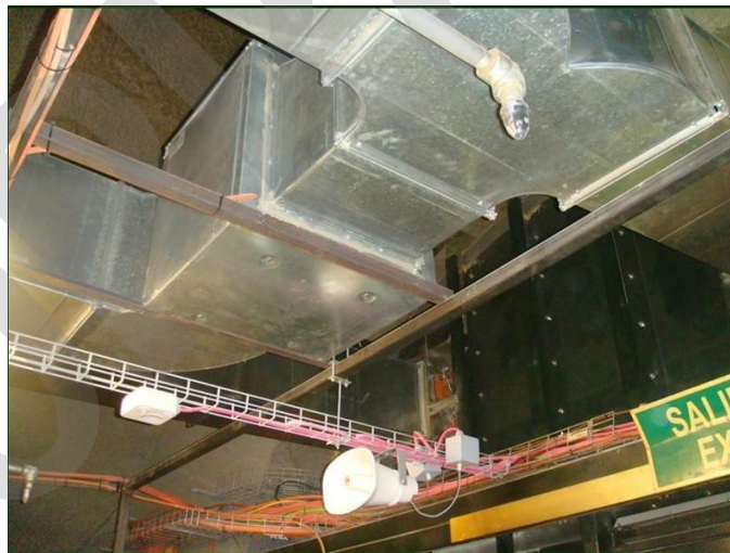
Imagen 5. Megafonía

El sistema de megafonía es un sistema de gestión de la emisión de avisos con propósito general y de evacuación de emergencia.