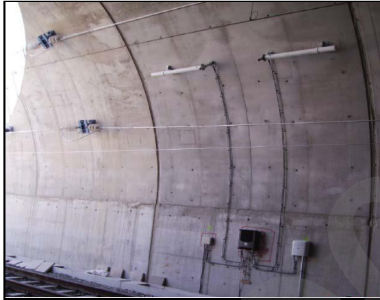
Imagen 4. Antenas

La antena es el dispositivo que radia y/o recibe ondas electromagnéticas.