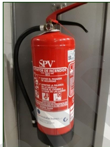
Imagen 8. Extintores

Equipo autónomo que contiene un agente extintor, el cual puede ser proyectado y dirigido sobre un fuego por la acción de una presión interna.