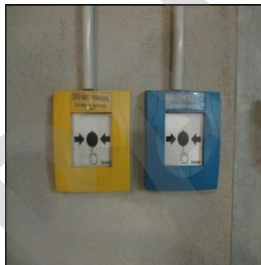
Imagen 13. Pulsador de extinción automática

El pulsador de extinción automática es un mecanismo manual de disparo y paro del sistema de extinción.