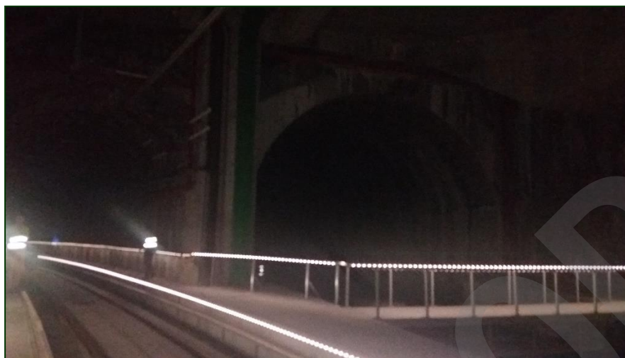
Imagen 19. Pasamanos iluminado

Este elemento estará asociado informáticamente al emplazamiento en el que se encuentra situado (tubo ferroviario, galería, etc.). Si el pasamanos se encuentra en un pasillo de evacuación, se asociará a la acera del tubo ferroviario, siempre sea posible.