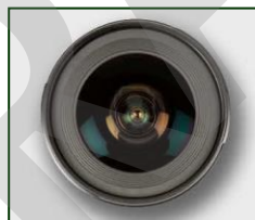
Imagen 24. Óptica

La óptica es la lente, asociada a la cámara, a través de la que se visualiza la escena.