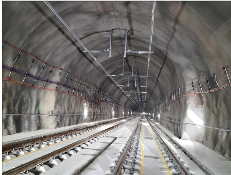
Imagen 21. Alumbrado de Emergencia

Sistema que sirve para iluminar los recorridos de evacuación, dentro o fuera de túnel, para facilitar el tránsito de personas en su camino hacia las zonas seguras en caso de evacuación. La iluminación permanente se recogerá como sistema de alumbrado de emergencia.