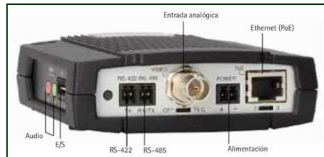
Imagen 25. Codificador de video

El codificador de video es un equipo capaz de convertir señales analógicas de video o datos en señales digitales con protocolo IP.