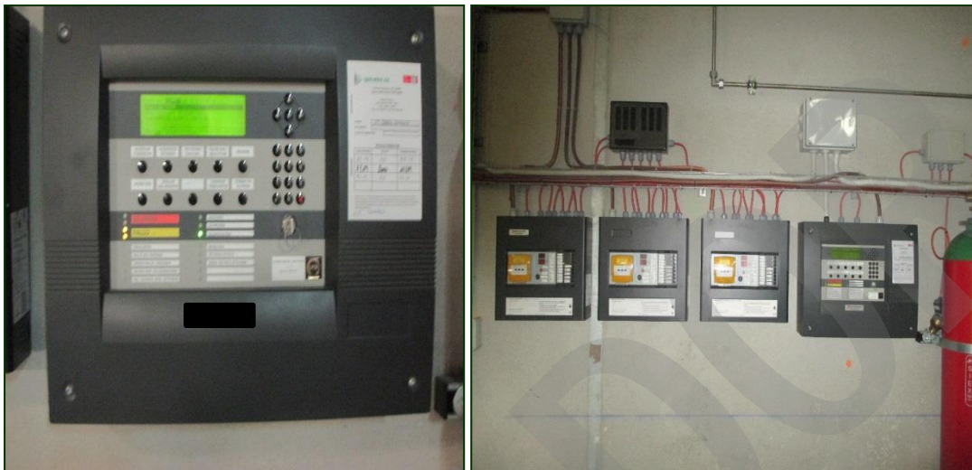
Imagen 15. Central de detección de incendios

Sistema gestor de elementos detectores dotado de todas las capacidades y elementos asociados para activar y generar los correspondientes avisos de los eventos detectados.