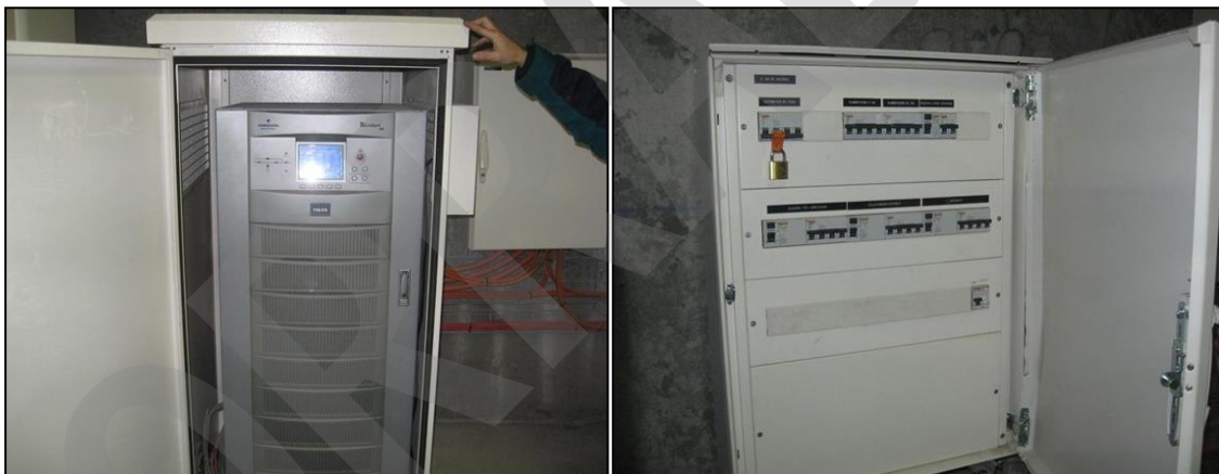
Imagen 28. Equipos SAI

El SAI es el Sistema de Alimentación Ininterrumpida que permite disponer de una alimentación estabilizada y suministrar energía eléctrica por falta de acometida eléctrica durante tiempo definido.