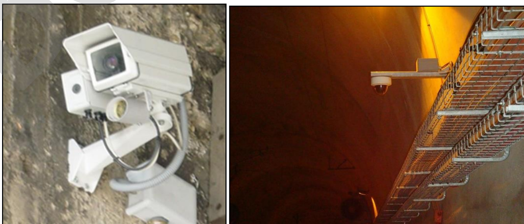
Imagen 23. Cámaras en túnel

Equipo compuesto fundamentalmente por un dispositivo captador de imágenes, un circuito electrónico asociado y una lente, que de acuerdo con sus características permitirá visualizar una escena determinada. Los elementos principales de la cámara son la Carcasa, la Óptica, el Foco Infrarrojo y el Conversor de fibra óptica.