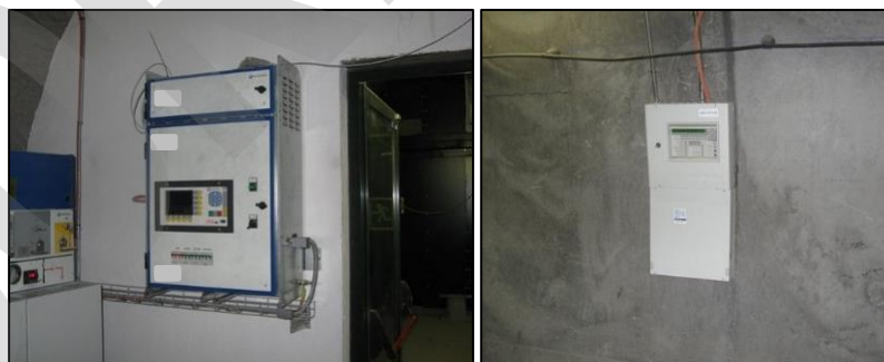
Imagen 12. Centralitas de extinción

Sistema gestor dotado de todas las capacidades y elementos asociados para activar la extinción y generar los correspondientes avisos de los eventos detectados.