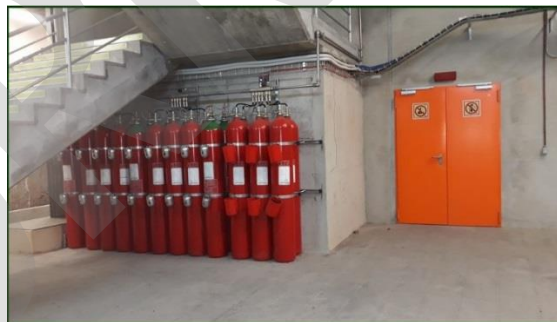
Imagen 11. Sistema automático de extinción

Sistema de extinción automática mediante boquillas o difusores encargados de detectar un conato de incendio y apagarlo mediante un agente extintor.