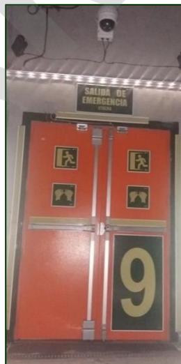
Imagen 20. Puerta abatible

Se anexará la siguiente documentación: proyecto/s constructivo/s, modificado/s, complementario/s y proyecto construido (as-built), etc. de cualquiera de sus elementos.