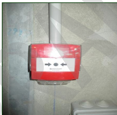
Ilustración 17. Pulsador de incendios

Dispositivo para la activación manual de alarma de incendio.