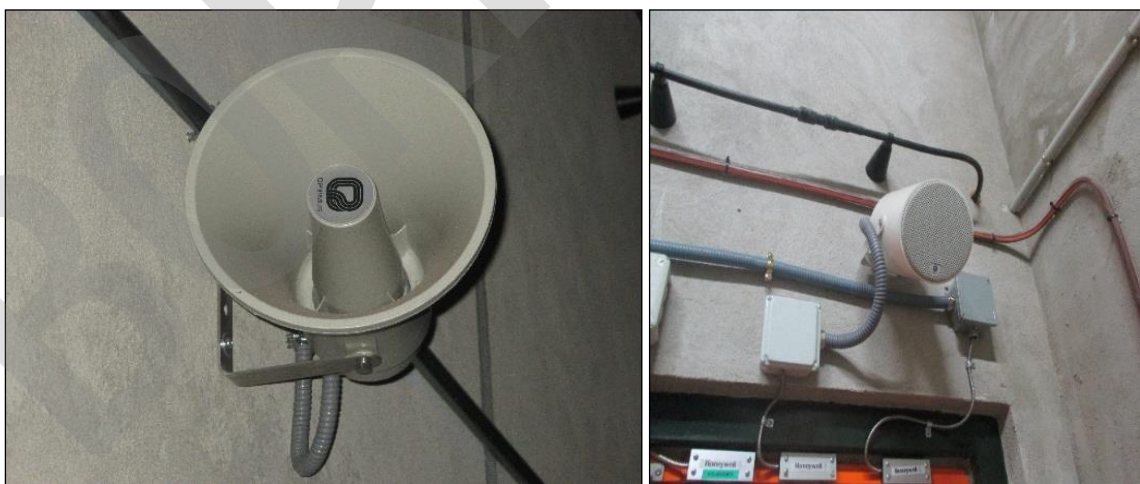
Imagen 6. Altavoces

Se define el altavoz como un proyector acústico.