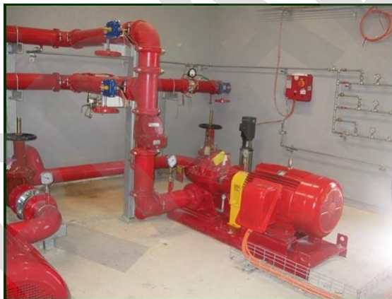
Imagen 14. Grupo de bombeo del sistema de Protección Contra Incendios

Es un grupo de presión cuyo objetivo es suministrar un caudal de agua determinado a una presión suficiente en los distintos puntos de suministro de una instalación de protección contra incendios.