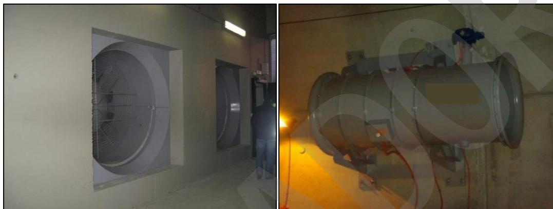
Imagen 2. Ventiladores

Se anexará la siguiente documentación: proyecto/s constructivo/s, modificado/s, complementario/s y proyecto construido (as-built), etc. de cualquiera de sus elementos.