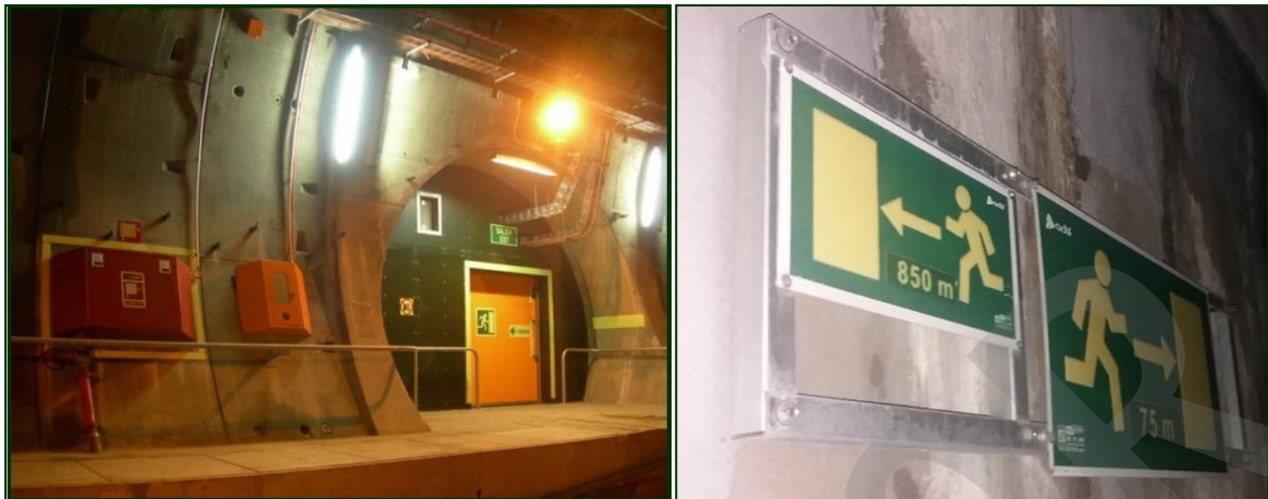
Imagen 18. Señales indicadoras de evacuación.

Este elemento estará asociado informáticamente al emplazamiento en el que se encuentra situado (tubo ferroviario, galería, etc.).