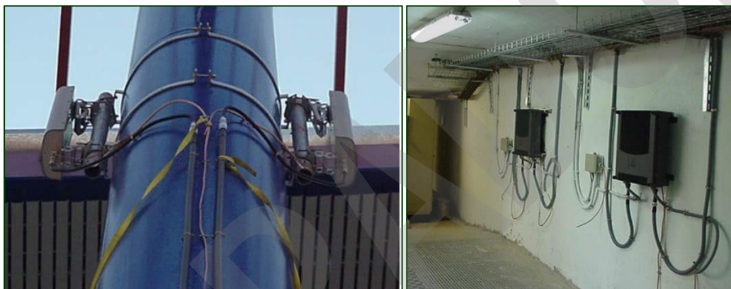
Imagen 3. Sistema de Comunicación por Cable Radiante. Repetidores

El repetidor es un dispositivo que restaura la señal a su estado original, amplificándola, permitiendo que el receptor la reciba en condiciones óptimas.