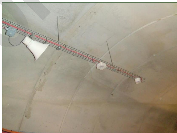
Imagen 16. Detector de incendios

Dispositivo para la activación automática de alarma de incendio. Disponen de indicadores de tipo LED o similar que indican el estado.