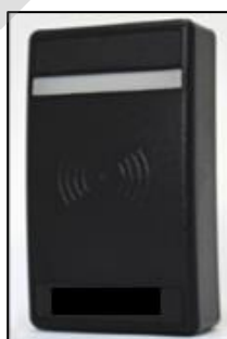
Imagen 27. Lector de tarjetas

Equipo que capta y lee la información procedente de un dispositivo de identificación, del tipo tarjeta principalmente, para proporcionársela al sistema a través de la unidad UCA a la cual se asocia.