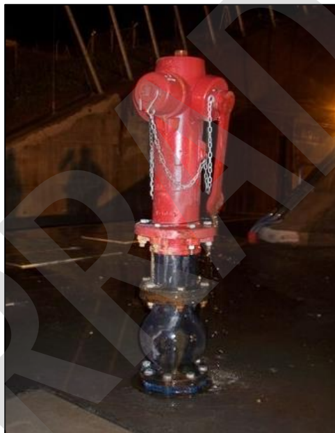
Imagen 9. Hidrante

Se define hidrante al aparato hidráulico que está conectado a una red de abastecimiento y que está destinado a suministrar agua en caso de incendio.