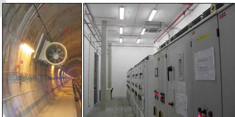
Imagen 1. Ventilación en túnel y Cuarto de Máquinas de Ventilación

Se entiende por Instalaciones de protección, al conjunto de equipos y sistemas de diferente naturaleza cuyas funciones específicas dentro de un emplazamiento, son la de prevenir y controlar los riesgos sobre las personas y los bienes y la de facilitar respuesta adecuada a situaciones de emergencia, que en última instancia es posibilitar la evacuación de los ocupantes minimizando las pérdidas personales. Estas instalaciones deben de cumplir con normativa vigente aplicable y actuarán en cooperación y colaboración con otras medidas, medios , etc., de protección.