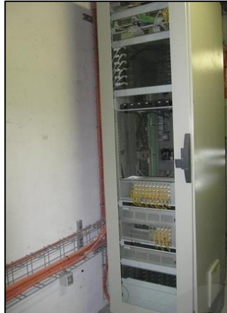
Imagen 30. Armario Fibra RACK

Son los armarios en los que se encuentran los equipos de los sistemas de protección y seguridad.