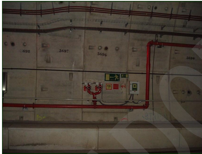
Ilustración 10. Toma siamesa.

Conexión auxiliar de un hidrante a través de la cual el departamento de bomberos puede abastecer agua para complementar los suministros.