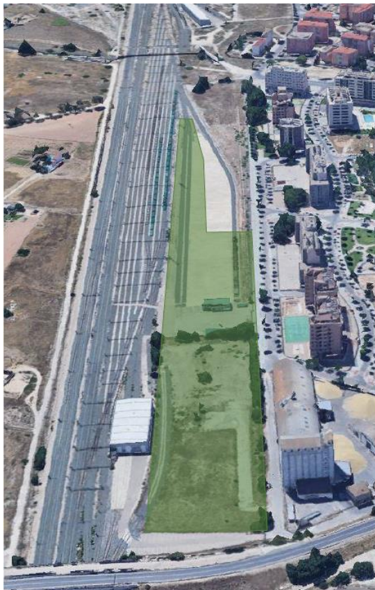
VISTA AÉREA DE LA T.T.M. DE ALBACETE, CON DELIMITACIÓN PERIMETRAL (EN VERDE) DEL ESPACIO OBJETO DE LICITACIÓN

En el siguiente plano se delimitan perimetralmente en color azul los espacios descritos, y en rojo la zona prevista para la ampliación: