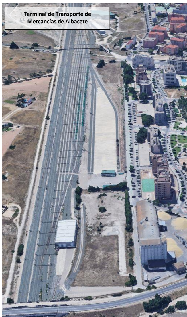
VISTA AÉREA DE LA TERMINAL DE TRANSPORTE DE MERCANCÍAS DE ALBACETE.

La Terminal de Transporte de Mercancías de Albacete, de titularidad de Adif, se encuentra ubicada en la calle Felipe V, al noreste de la ciudad, entre las autovías A-31 y A-32, y la estación de Albacete-Los Llanos, y conecta directamente con Madrid, Valencia, Alicante y Murcia.