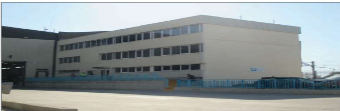
Vista exterior del edificio de oficinas

Las plantas de dichas oficinas están representadas en el plano número 5.