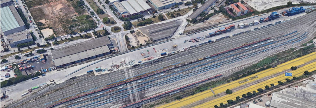
Vista general de la terminal

Las imágenes de la parcela se encuentran representadas en el plano número 4 y el esquema de vías en el plano 6.